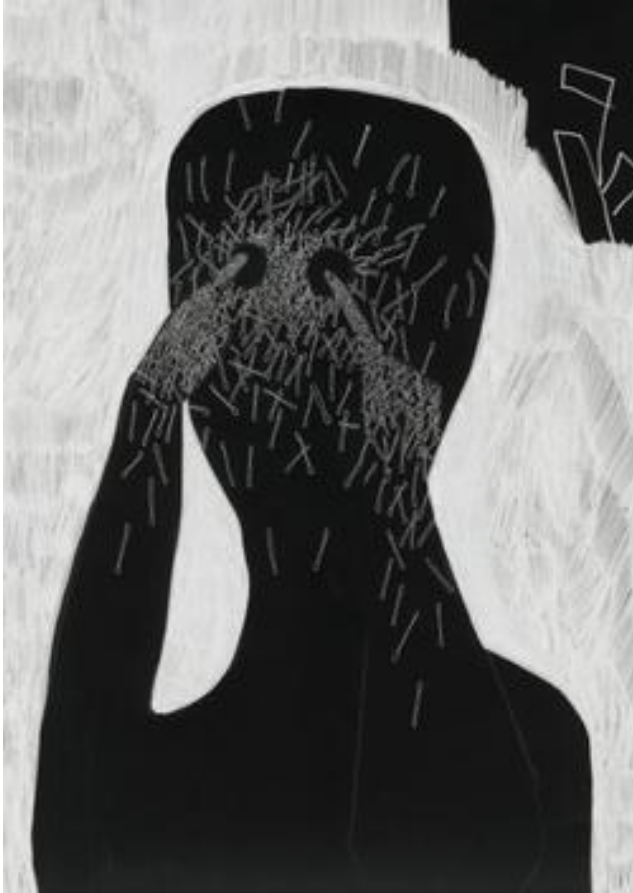
Hanne Ulla (2013). Do not tell me too much. Blyant på papir.

Vi vender oss mot veiledningsfaglige grunnproblematikker, og løfter fram ontologiske, epistemologiske og aksiologiske tilnærminger ved profesjonsveiledning.